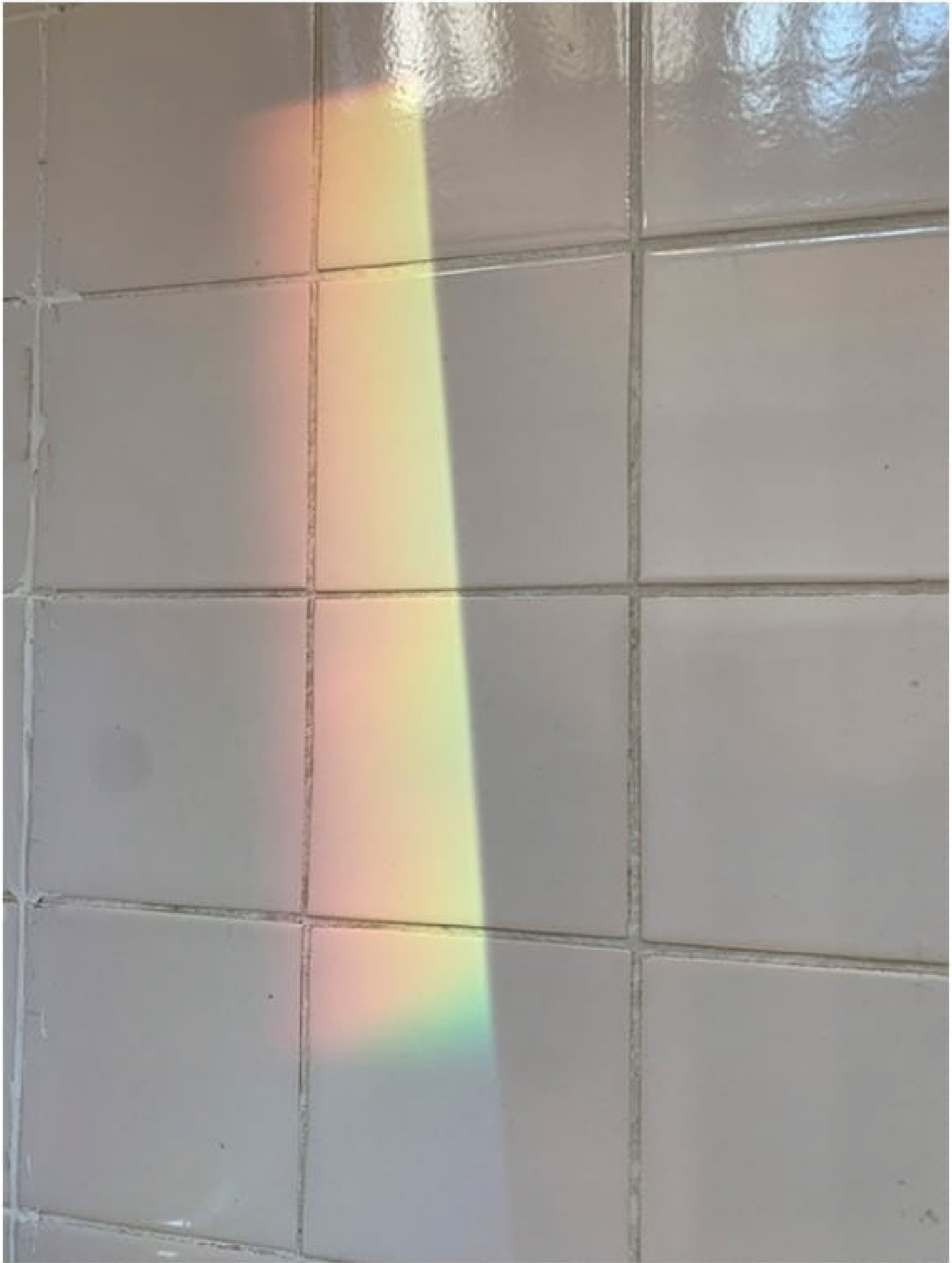
Filipa Pestana. Lost Rainbow, 2023. Impressão sobre papel mate 180 gr.