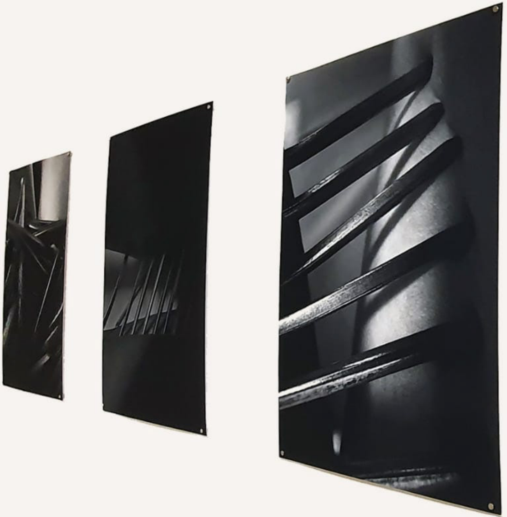
Filipa Pestana. Série / Series: Plasticidade neuronal, 2025. Impressão sobre papel mate 180 gr, A3.